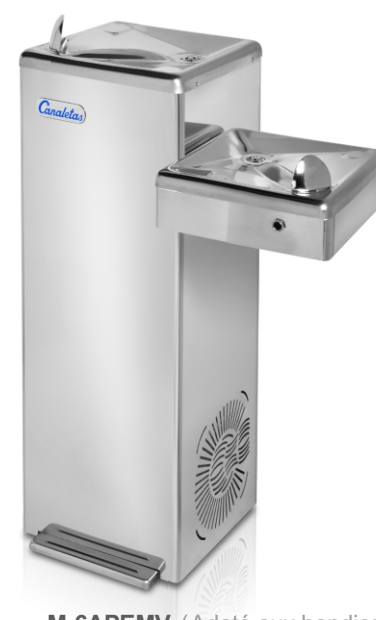
M-6APEMV (Adapté aux handicapés )